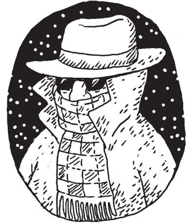
Podoba Járy Cimrmana, jak ji zachytil neznámý fotograf ve sněhové vánici v lednu 1911.