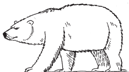
LEDNÍ MEDVĚD – úbytek přirozeného prostředí