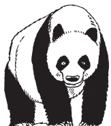
PANDA VELKÁ – úbytek zdroje potravy