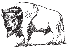
BIZON AMERICKÝ – lov pro kožešinu