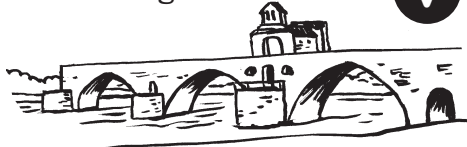
most v Avignonu

Dokážeš podle příběhu přiřadit název mostu a určit, zda most stále stojí? V jaké zemi bys ho hledal? Pokud správně spojíš obrázek mostu s příběhem, vyjde ti tajenka.