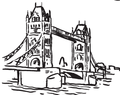
Towerský most v Londýně

Nápad vystavět kamenný most přes Vltavu je přičítán pražskému biskupovi Danielovi, jenž se po zničení původního dřevěného mostu r. 1157 inspiroval kamennými mosty v Itálii a mostem v bavorském Řezně. Velkou podporu našla stavba zejména v choti krále Vladislava II, Juditě Durynské, po níž později dostal jméno. Stavbu prováděli stavitelé povolání z Itálie. Most stál dlouhých 170 let, než byl v roce 1342 stržen velikou přívalovou povodní.