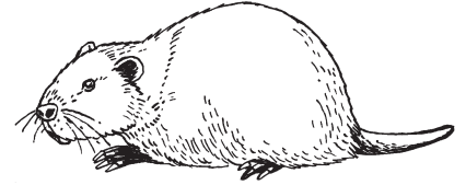
nutrie ondatra pižmová norek americký

1. Projdi si všechny skupiny druhů a ke každé zapiš svůj názor na otázku: Jak podle tebe doprava ovlivňuje nebo ovlivnila život, potravní zvyklosti či územní rozšíření této skupiny zvířat?