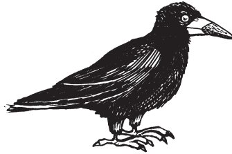
havran polní sup mrchožravý bělozubka šedá